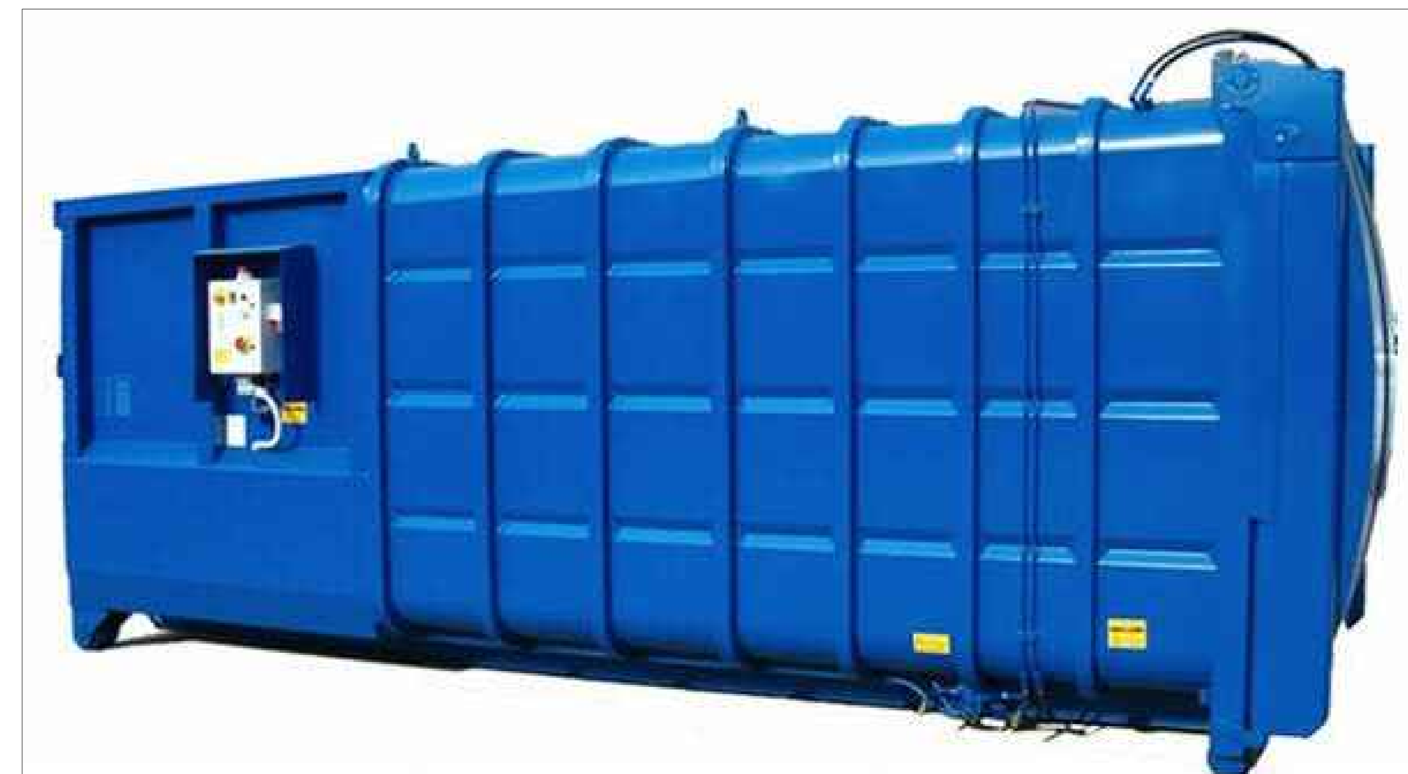
Particolare - Compattatore scarrabile a cassetto