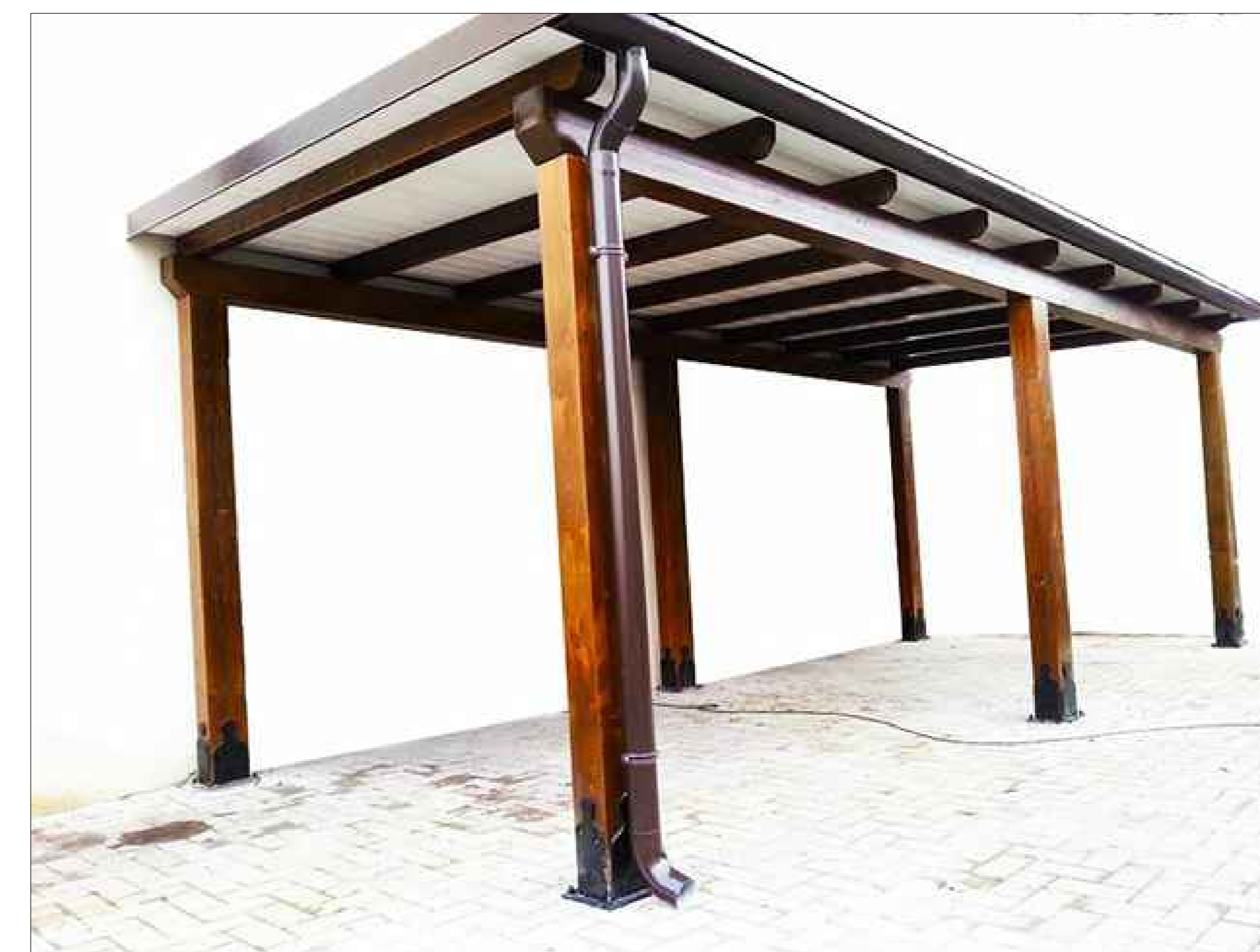
Particolare - Centro di riuso