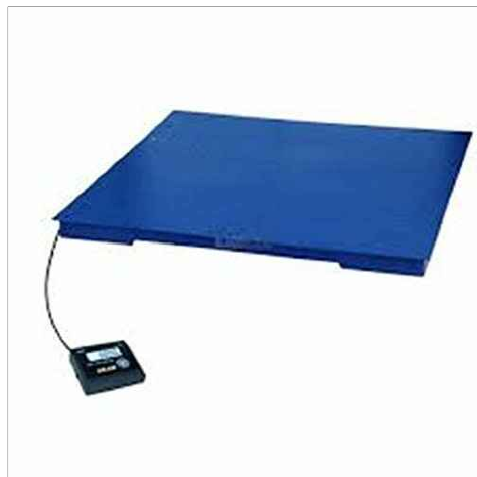
Particolare - Pesa manuale