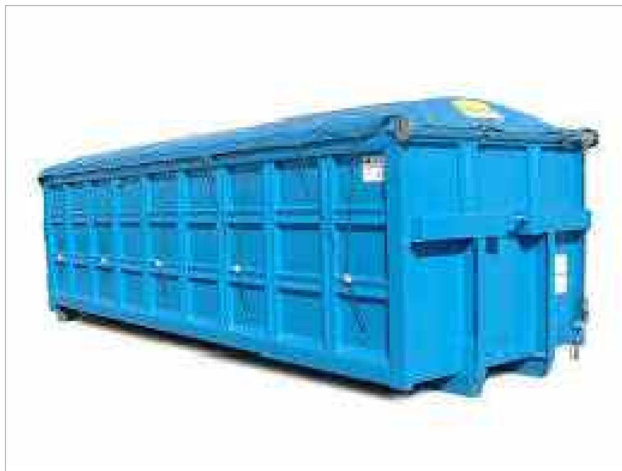
Particolare - Cassone scarrabile a cassetto