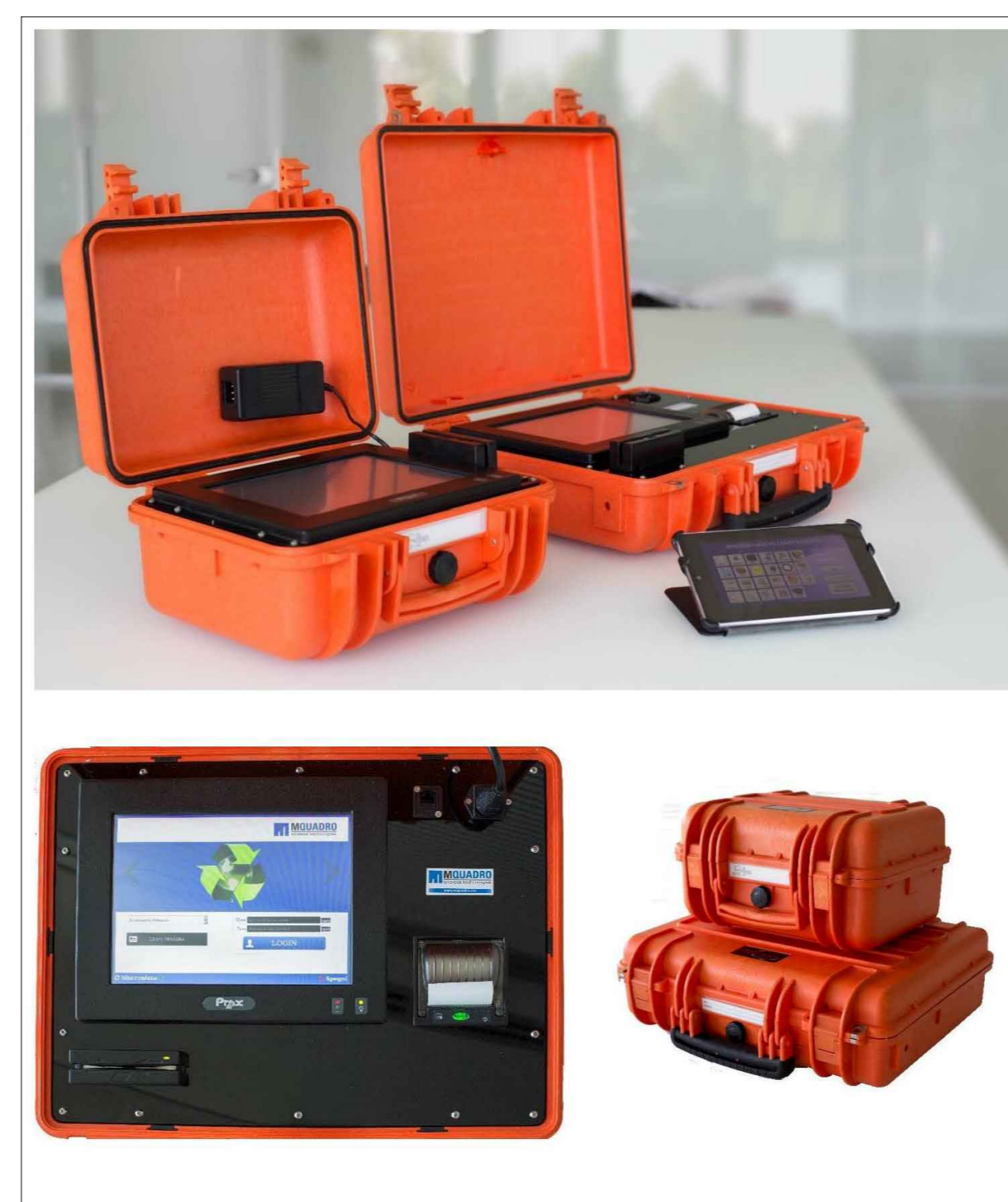
Particolare - Gestore raccolta rifiuti